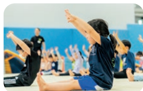
2023年10月29日レイズ体操クラブで開催された「白井健三の体操ラボ」。4歳から中学生までの約110名が参加し、コツを教わりました。

現在は指導者として活動する白井さん。目を引く選手について「頑張る力を持った選手ですね。たとえその場でうまくできなくても、できるまで練習し続ける子は伸びますし、自分を理解することができるんです。自分がわかるというのは、社会へ出て大事なことだと思います」と熱を込めます。最後に、夢に向かって頑張る皆さんへメッセージをもらいました。「体操だけではなく、いろんなことに挑戦して、とにかく楽しんでください。周りと違って自分が好きなことを突き詰めていくと、立派な強みになるので大事にしてほしいです」